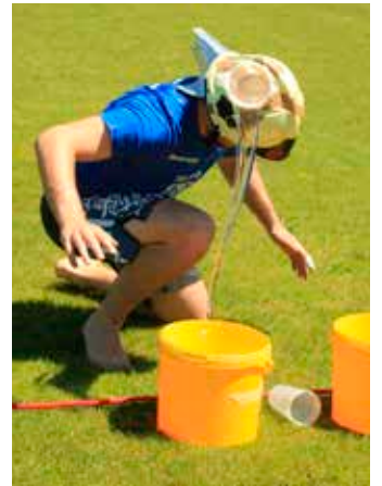
70 Jahre PSV: Spiel ohne Grenzen am 29.6.2019 am Florianseck